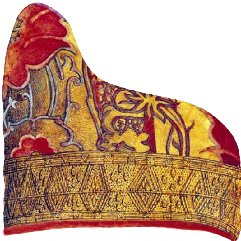
Il corno dogale o berretto del Doge.

Festa della Madonna della Salute e Presentazione della Beatissima Vergine Maria al Tempio