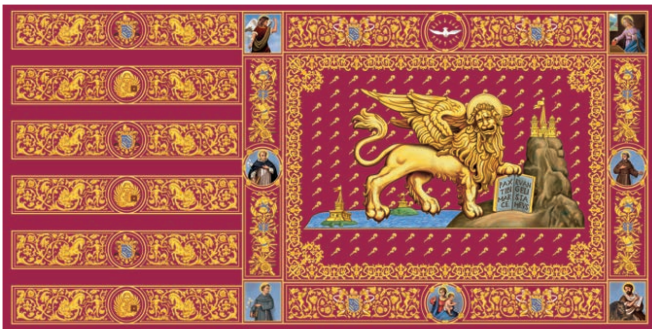
La bandiera del Doge Contarini (secolo XVII) nella tradizionale versione orizzontale, interamente ridisegnata dall'illustratore Oliviero Murru.

La bandiera, nella sua tradizionale versione orizzontale, come qui sopra si vede, è stata riprodotta in un numero limitato di esemplari, stanti gli elevatissimi costi affrontati; ed è disponibile nei seguenti formati e ai seguenti prezzi di costo: